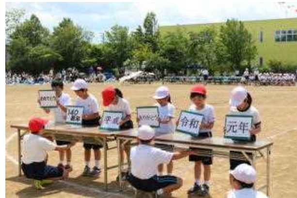
<「平成から令和へ～そして140周年」>

競技では、創立140周年や新元号「令和」にちなんだ種目がたくさんありました。3年生の技能走「平成から令和へ～そして140周年」