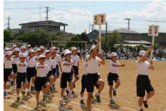
<堂々と胸を張っての入場行進>

得点は、前半は赤組がリード、午前の部では一時238対238と同点になるなど、白熱した戦いとなりました。午後の団体戦では白組が優勢となり、最後は白組が優勝しましたが、まさに児童会で考えたテーマ「必勝だ！ 熱く戦え 最後まで」のとおり、創立140周年記念にふさわしい運動会となりました。皆様の応援、ありがとうございました。