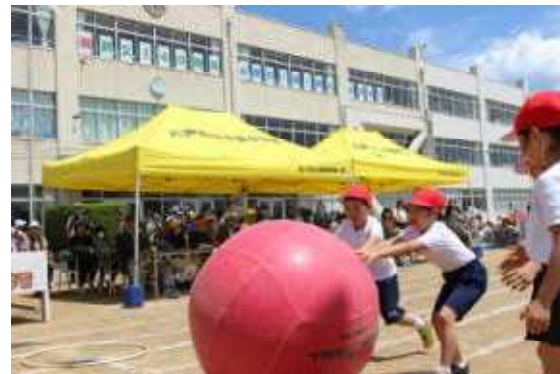
<上手に大玉をころがす2年生>

では、「令和」と書かれた紙を持って、「新しい元号は、令和であります。」と言ってからゴール。4年生の技能走「ねらえ！140周年記念ボール！」では、卓球のラケットやおもちゃのバットを14回振ってから走りました。2年生の技能走「140周年のお祝いにチョコプラ登場?!」では、下長小学校創立140周年をお祝いするために、お笑い芸人のチョコレートプラネットが駆けつけてくれたという設定で、子どもたちが「そろり、そろり。」と言いながら走